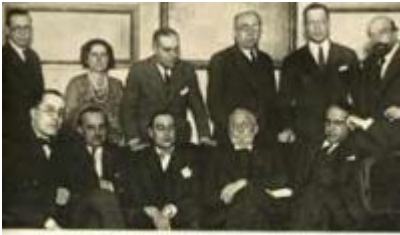
1930-40-47: Mundo Gráfico. Junta de Gobierno presidida por Marañón

28 de junio.- Con motivo de la conmemoración del cincuentenario de la muerte del doctor Marañón y en reconocimiento a su relevancia histórica, el Ateneo de Madrid, la Fundación Ortega-Marañón y la Fundación Tejerina han acordado la creación de la cátedra Marañón, con sede en el Ateneo.